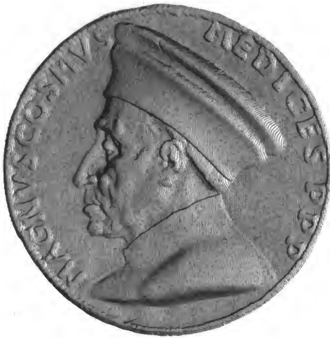
COME PERE DE LA PATRIE.